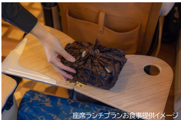
座席ランチプランお食事提供イメージ