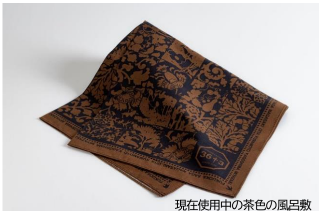
現在使用中の茶色の風呂敷

※現在使用している茶色の風呂敷は車内販売商品で引き続きお買い求めいただけます。 車内販売価格:550円(税込) ※2023年2月現在